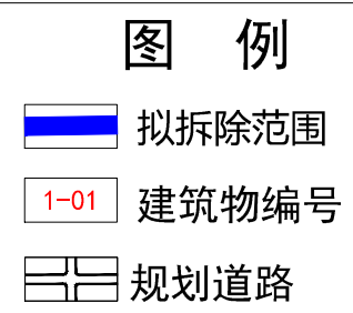
深圳市龙华区民治街道白石龙二区城市更新单元项目范围图