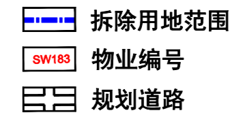
深圳市龙华区观湖街道松元厦社区上围-太兴-中心村城市更新项目范围图