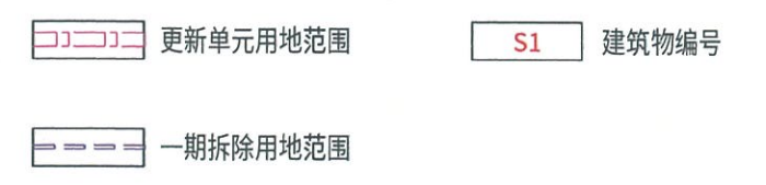
深圳市龙华区大浪街道上下横朗城市更新项目（一期）范围图