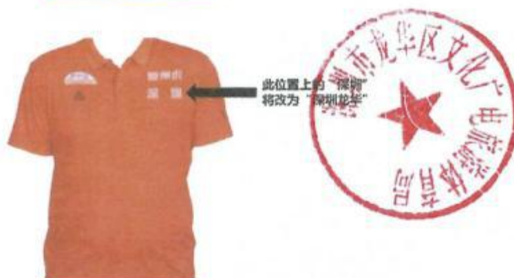
出场服广告示意图