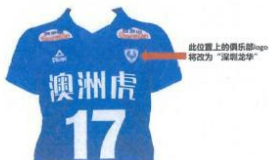
比赛服广告示意图