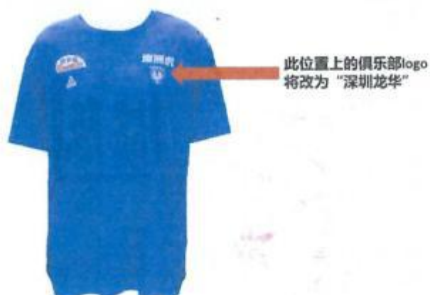
训练服广告示意图