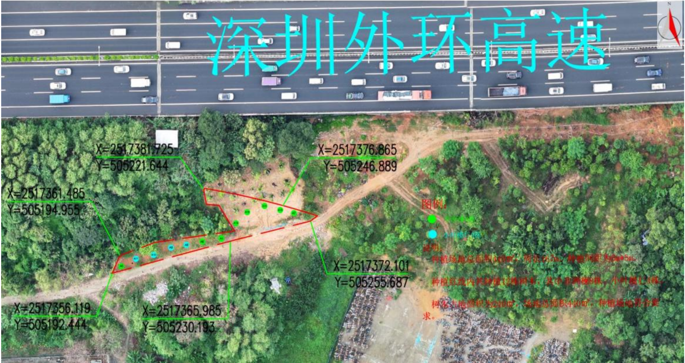
树木种植点位示意图