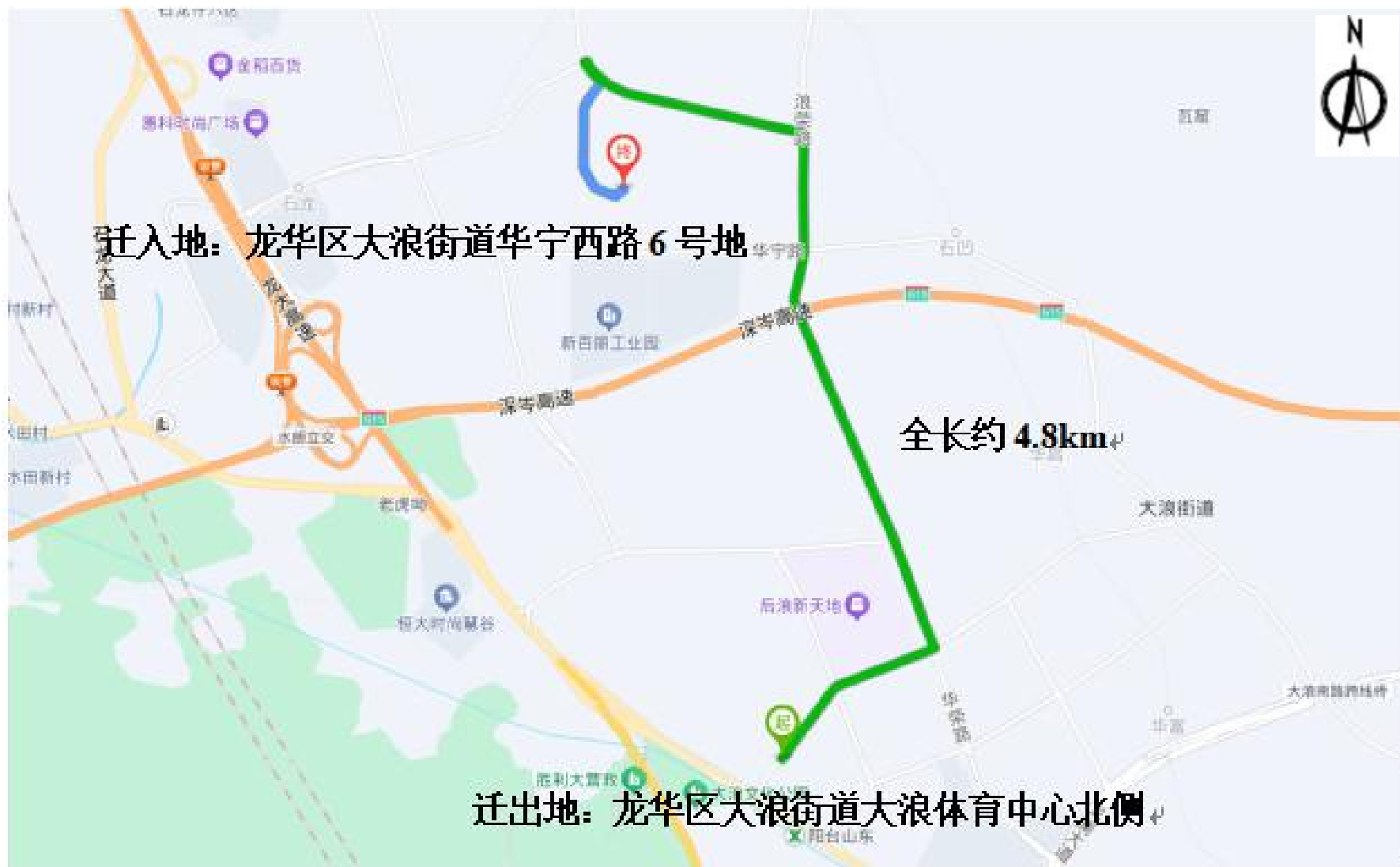
种植场地迁移路径图