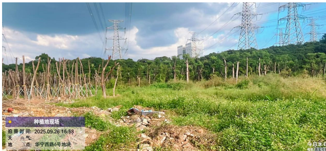
种植场地现场照片