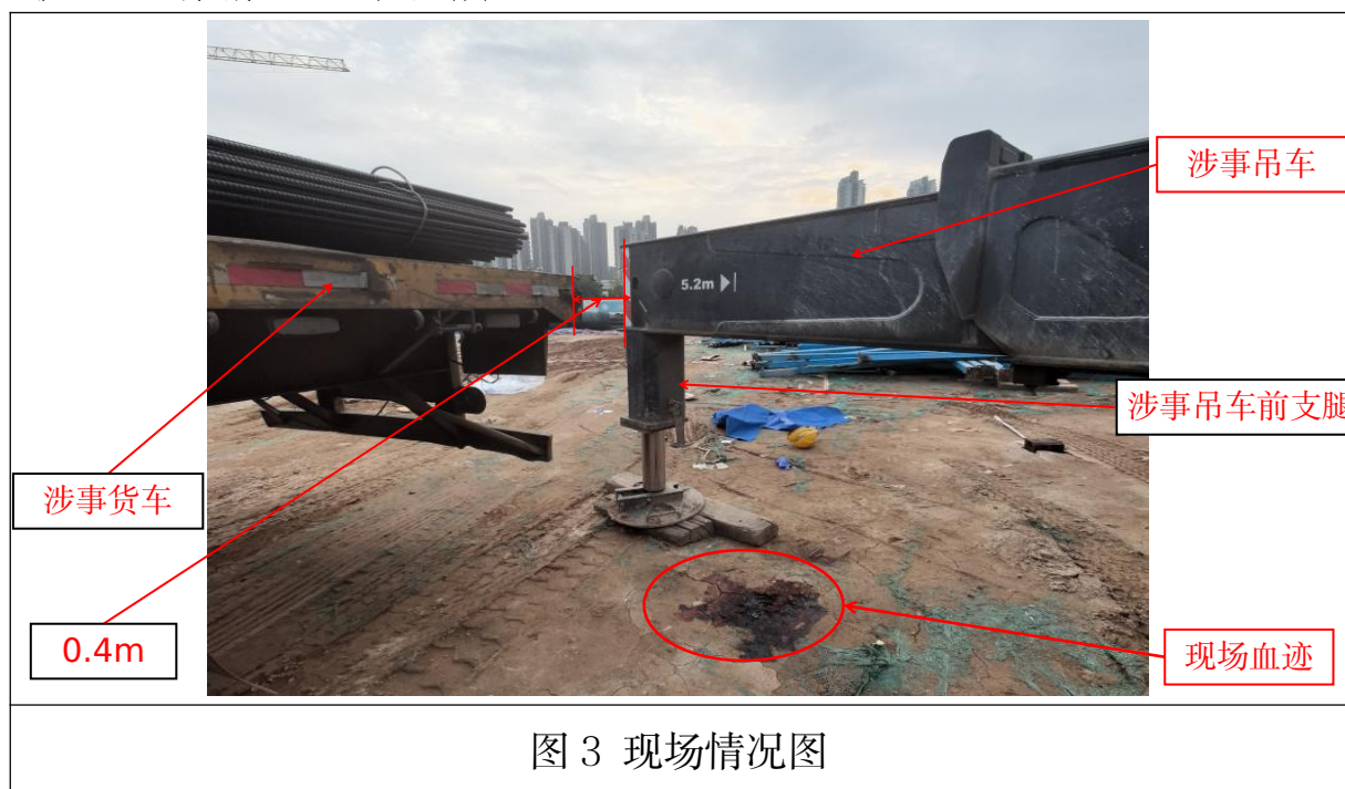
图 3 现场情况图

日 23 时许，深圳承启达公司驾驶员彭森林驾驶涉事货车与公司另外 2 台平板货车运输该批钢筋到涉事工地准备卸货，因前面 2 车钢筋已堆满材料堆场，13 日凌晨，涉事工地项目劳务分包单位（深圳通盛劳务有限公司）材料员陈世杰请示八局深圳建筑公司材料员陈磊后，告知彭森林将第三车钢筋拉到工地围栏内物资临时堆放点并在此处卸货。彭森林按要求准备将车倒在指定位置，涉事吊车随车人员李秀辉自发到涉事货车后方，为彭森林指挥倒车。13 日凌晨 3 时许，彭森林按照指挥，在正常倒车过程中将指挥倒车的李秀辉挤压在涉事吊车支腿上，导致李秀辉受伤，现场情况如下图所示：