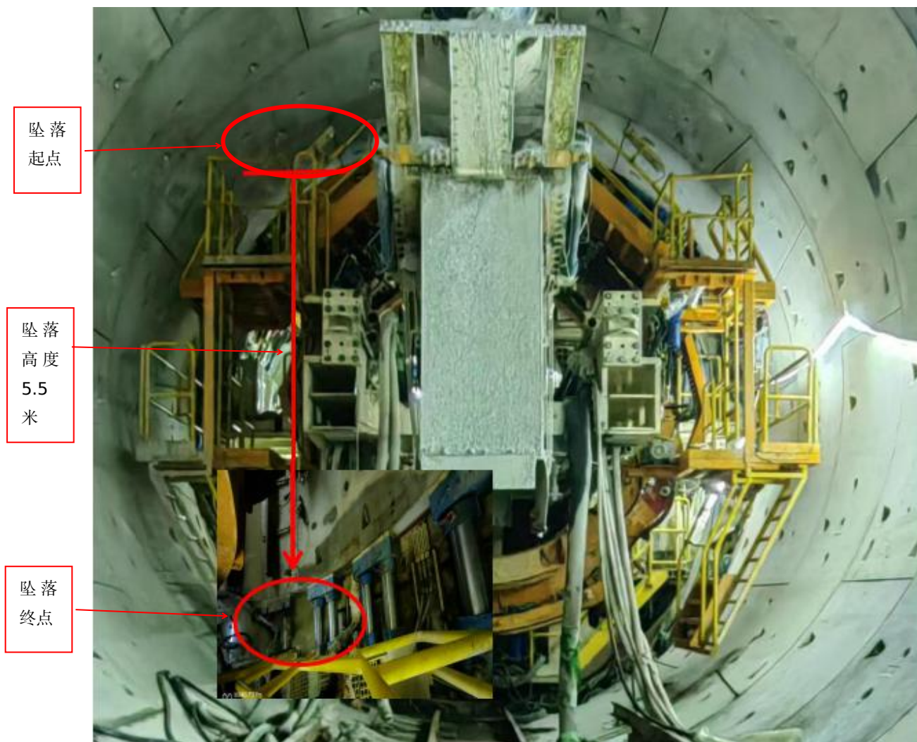
图 3 伤者坠落至推进油缸处