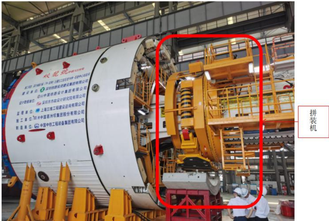
图 1 DZ1185 盾构机