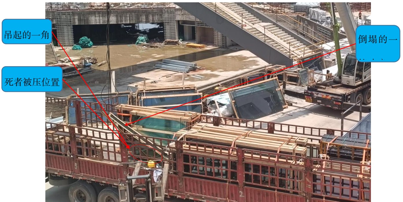
图 2 事发区域细节