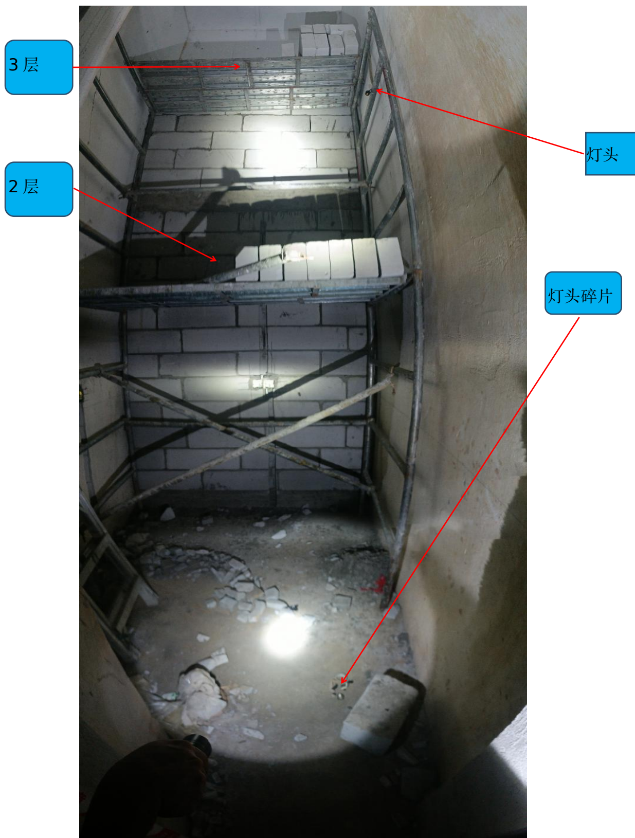
图 4 事发茶水间内全景图