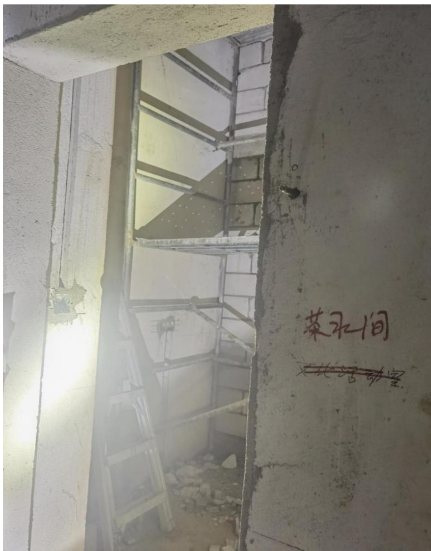
图 3 事发公配房茶水间

事发时施工班组在公配房文化活动区域茶水间进行砌筑隔墙等施工活动（如图 3、4 所示）。