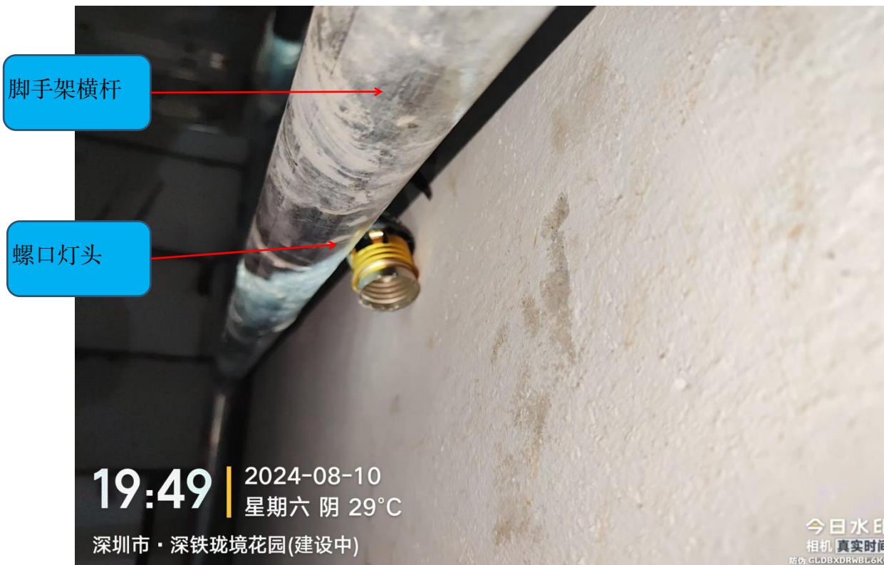
图 5 事发茶水间内临时用电照明灯灯头经还原情况

3. 将涉事茶水间内临时用电照明系统还原至事发前状态将其通电，可在脚手架架体及与之接触的金属物体上可测得对人体危险的电压（188～235V）。